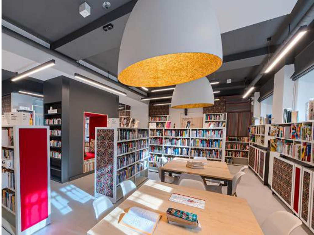
Zdjęcie 3 Nowa przestrzeń przy ul. Nowolipki 21