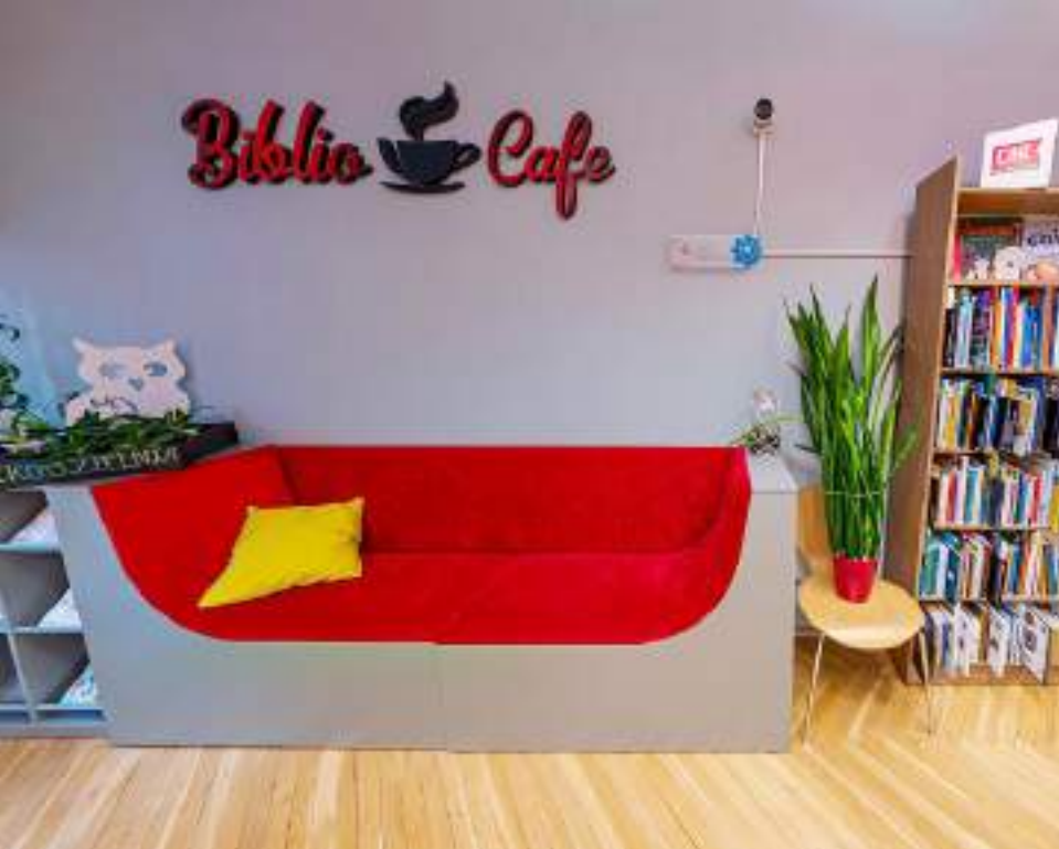
Zdjęcie 1 Biblio-Cafe obecnie