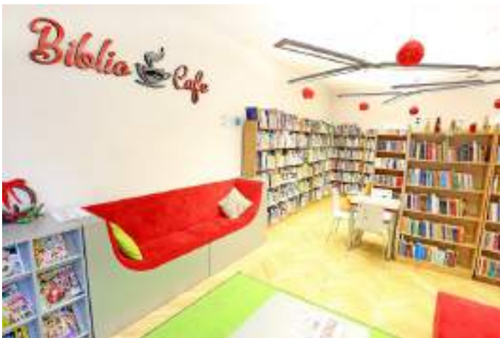
Zdjęcie 2-3 Biblio-Cafe w 2016 roku

10 października 2016 roku w Bibliotece dla Dzieci i Młodzieży nr 25 - „Ekoteka” udostępniliśmy Biblio-Cafe, przestrzeń wykorzystywaną według upodobań i potrzeb, głównie młodzieży.