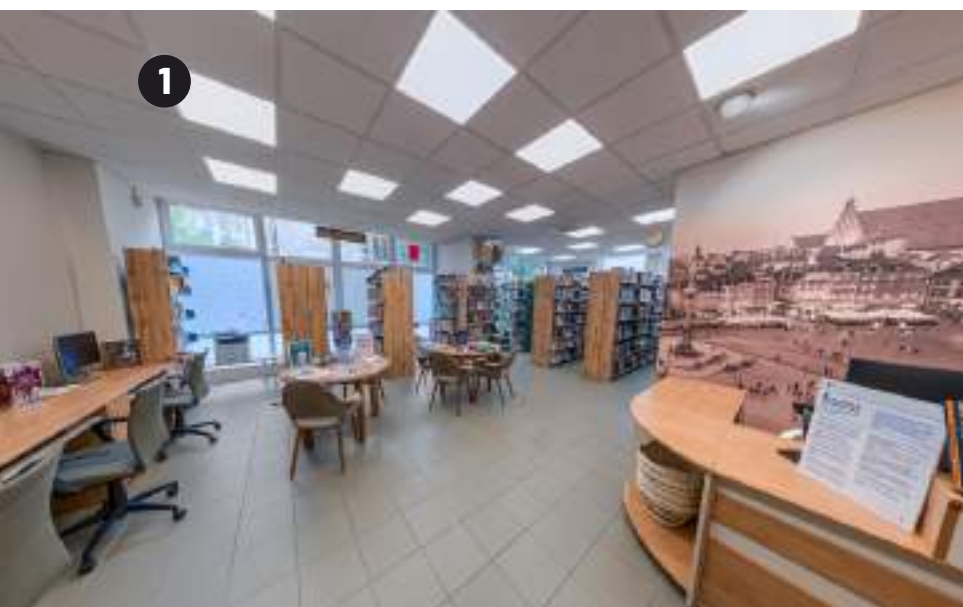
Zdjęcie 1 „Biblioteka z Historią” obecnie