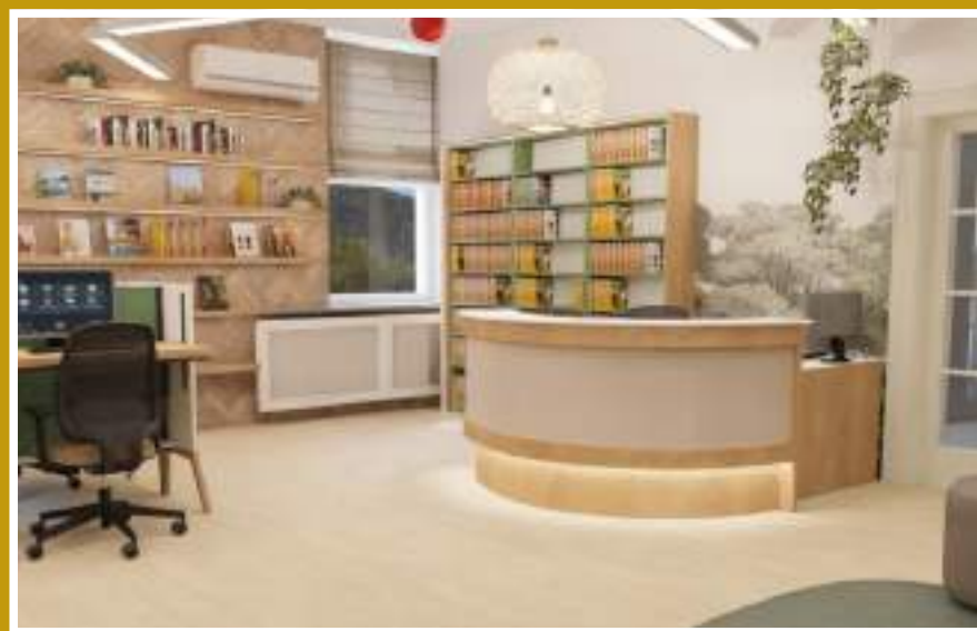
Wizualizacja części dla dzieci i młodzieży w „Ekotece”