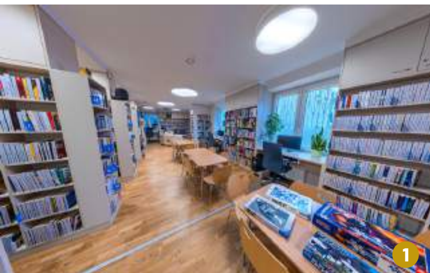
Zdjęcie 1-2 Efekt końcowy remontu