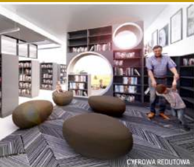
Wizualizacja przestrzeni Biblioteki „Cyfrowa Redutowa”

Na 2024 rok zaplanowane zostały nowe inwestycje i metamorfozy. Biblioteka „Cyfrowa Redutowa” przy ul. Redutowej 48 zostanie generalnie wyremontowana i odmieniona. Efektem ma być nowoczesna i atrakcyjna aranżacja. „Ekoteka” przy ul. Żytnej 64 przejdzie metamorfozę. Zmiany, które szykujemy będą z zastosowaniem ekologicznych i recyklingowych rozwiązań. Natomiast taras przed budynkiem Biblioteki przy al. Solidarności 90 będzie zazieleniony i ukwiecony. Dzięki temu stworzymy przyjazną i estetyczną przestrzeń przed Biblioteką.