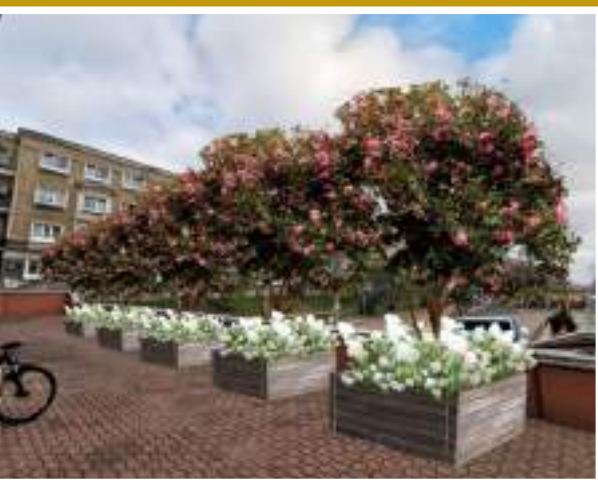
Wizualizacja tarasu przed Biblioteką przy al. Solidarności 90

BIBLIOTEKI: UL. REDUTOWA 48 / UL. ŻYTANIA 64 / AL. SOLIDARNOŚCI 90