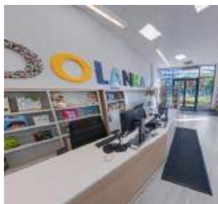
Zdjęcie 1-3 Przeźnię nowęj filii Biblioteki na Woli