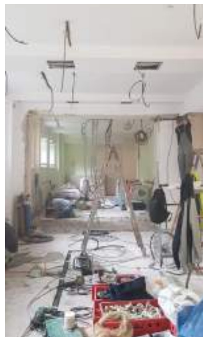
Zdjęcie 6-7 Poprzednia przestrzeń Poliglotki przy ul. Nowolipie 20