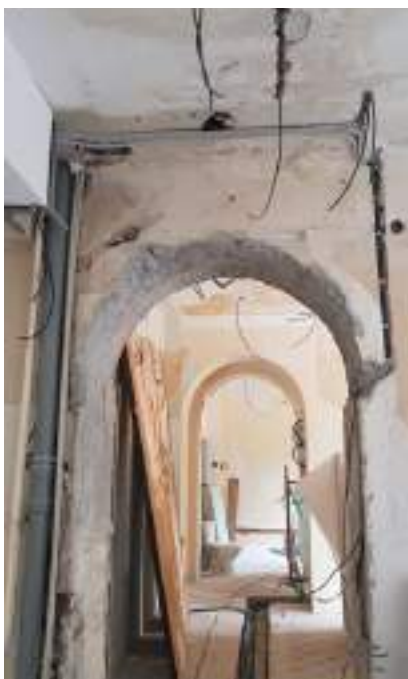
Zdjęcie 4-5 Prace budowlane przy ul. Nowolipki 21